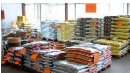
Erdmischungen, allgemeine Infos