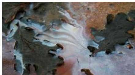
Mikroorganismen im Anbaumedium