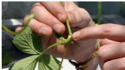
Benutzung von Erdmischungen