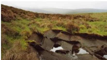
Was ist in Erde drin?